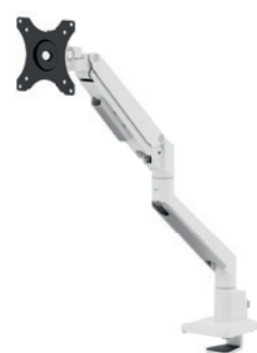
DS70-250BL1 / WH1 / SL1 Bildschirmgröße: 17-35" Tragfähigkeit: 9 kg