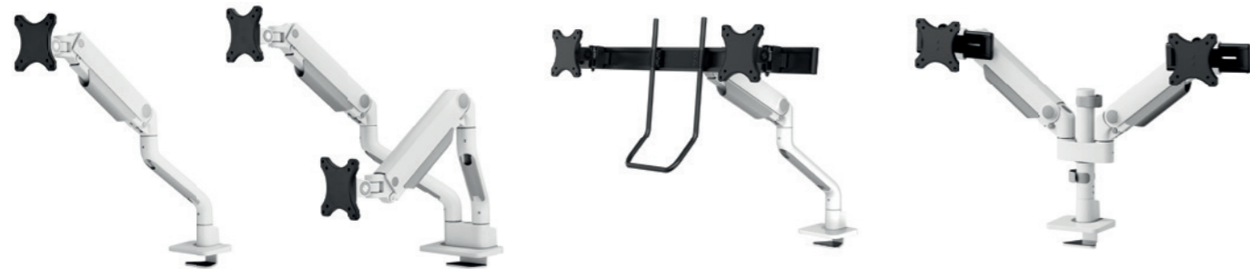
DS70S-950BL1 / WH1 Bildschirmgröße: 17-49" Tragfähigkeit: 18 kg/Curved 15 kg Verstärkter Kopf