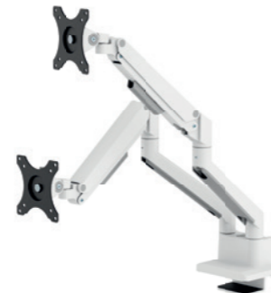
DS70-250BL2 / WH2 / SL2 Bildschirmgröße: 17-32" Tragfähigkeit: 9 kg (2x)