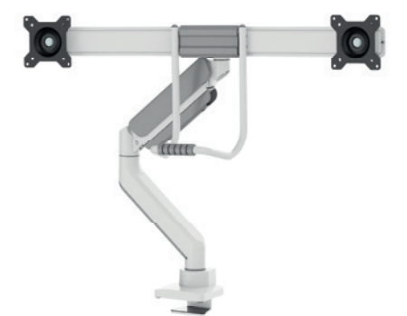
DS75-450BL2 / WH2 Bildschirmgröße: 17-32" Tragfähigkeit: 8 kg (2x)